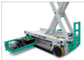
Montaggio dei componenti razionale e di facile manutenzione.