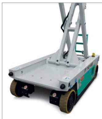
Design del carro base pensato per una facile pulizia.